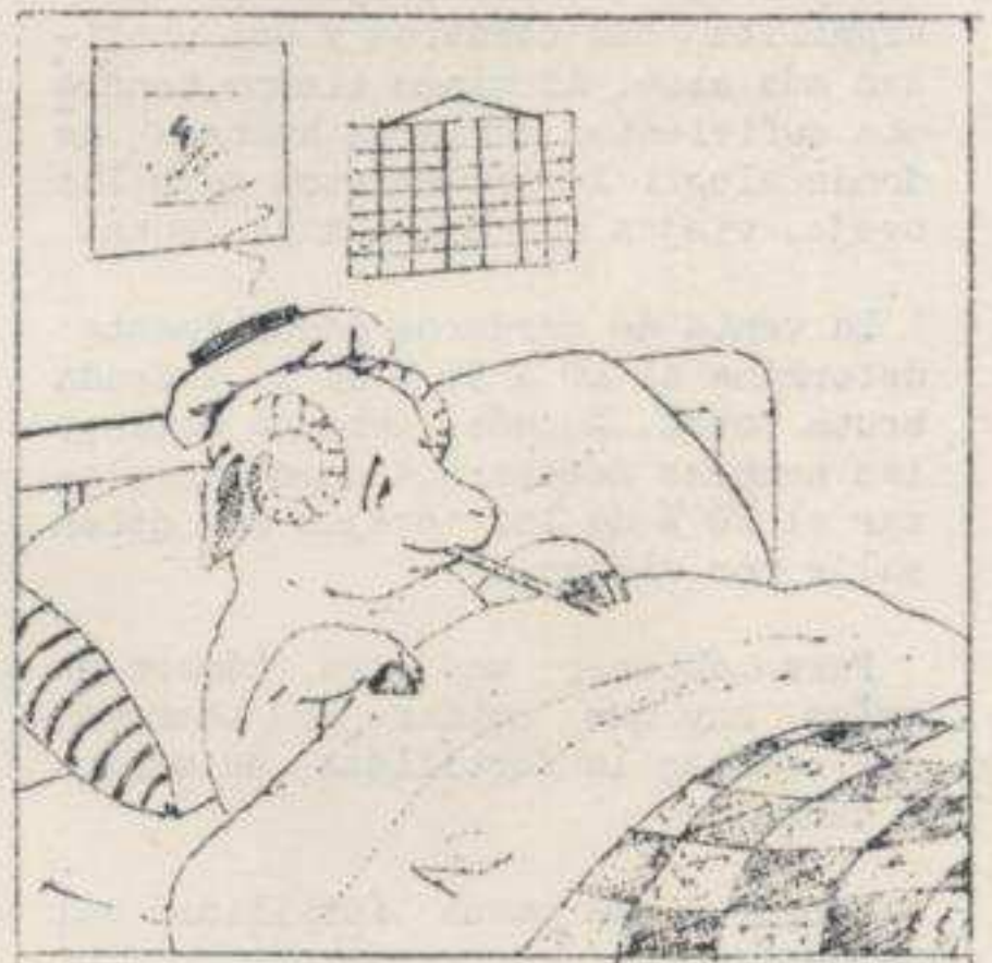
No se deben usar carneros que estén o hayan estado enfermos.