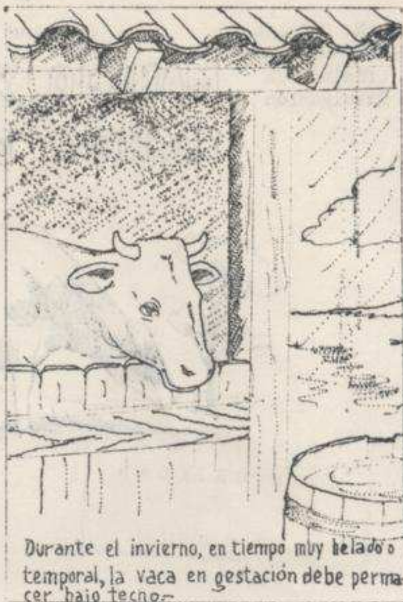
Durante el invierno, en tiempo muy helado o temporal, la vaca en gestación debe permanecer bajo techo.

Es necesario estar atento a la fecha en que se va a producir el parto, pues éste es un momento crítico, tanto para la madre como para el hijo. Una atención inadecuada o negligente