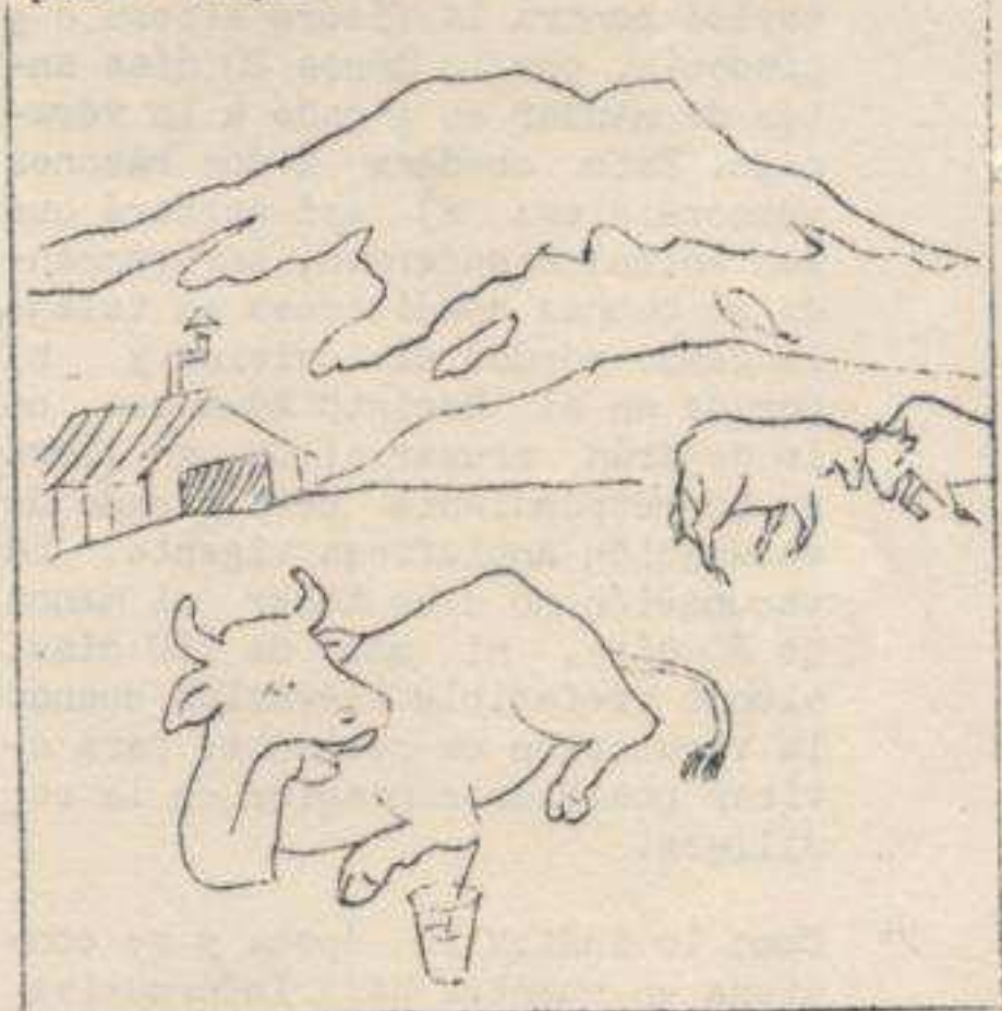
- A a a a a h ! ! ; Qué vida ! !