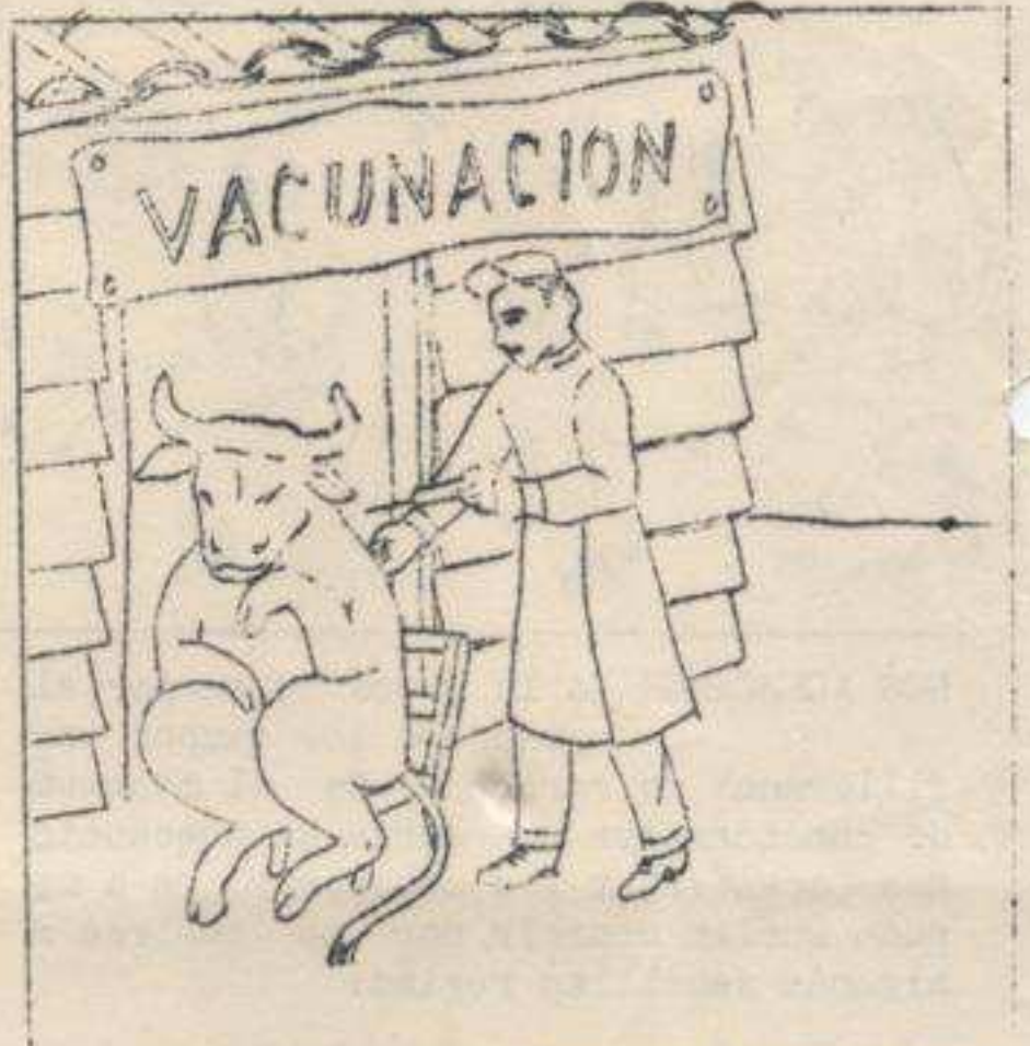
- ¡Las torturas que hay que sufrir para poder viajar!