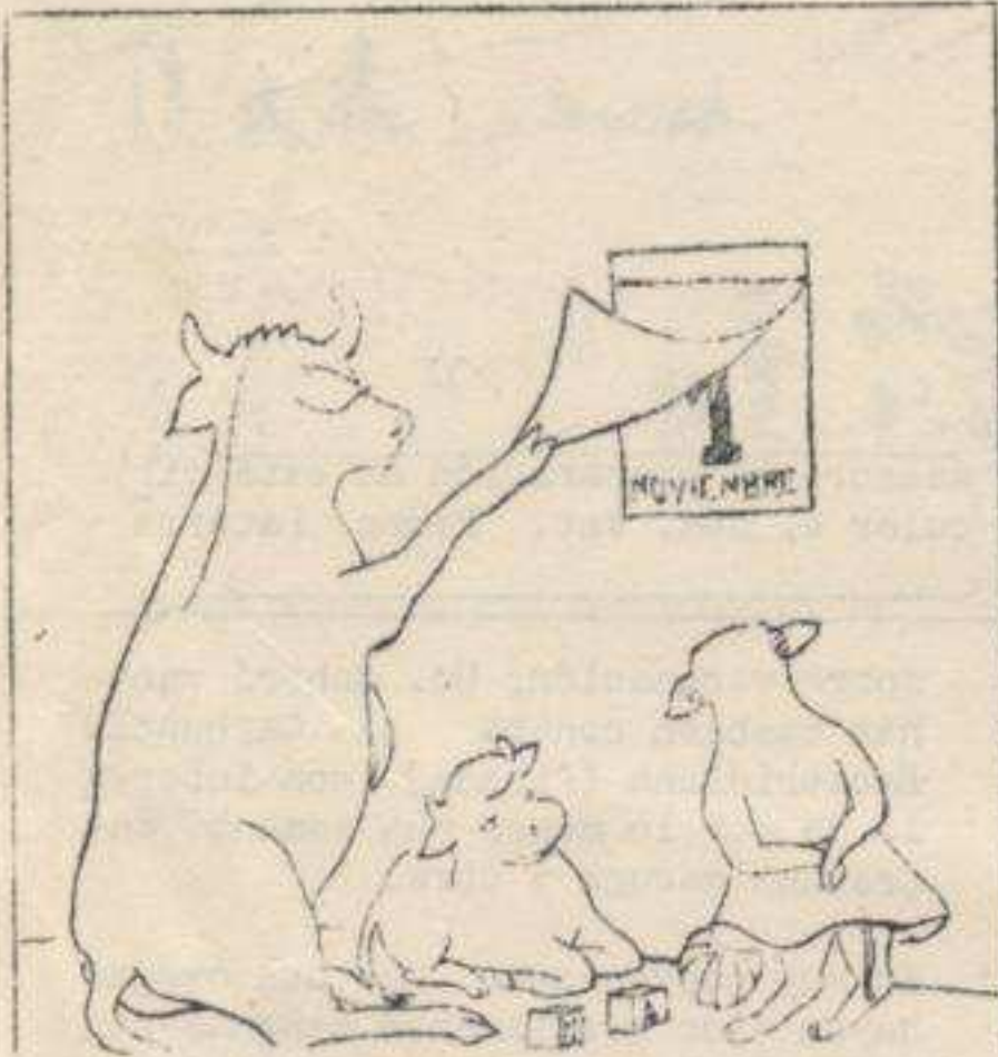
- ¡Niños! Llegó la época de vacaciones.

TOMANDOSE estas sencillas medidas de prevención, tendrá ganado sano y ganará dinero. Una ganadería próspera significa más ingreso para Ud. y más alimentación para nuestro pueblo.