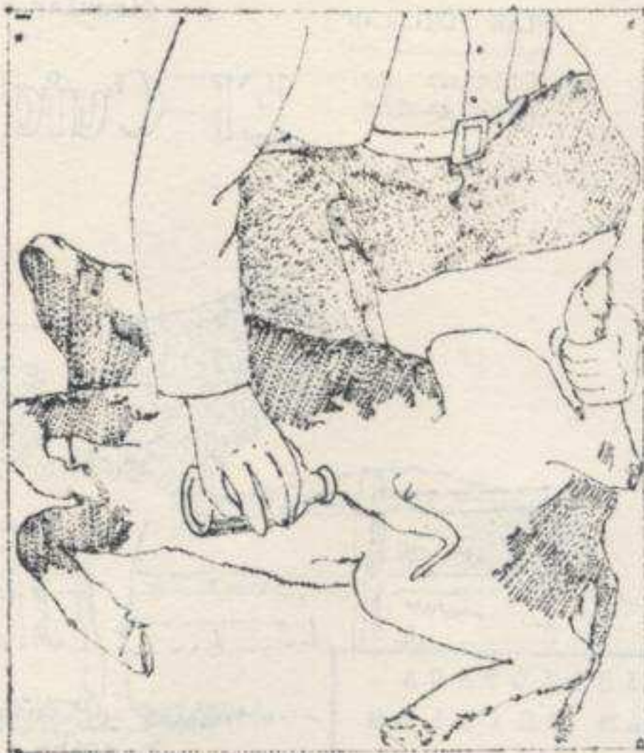
Debe desinfectarse el cordón umbilical con tintura de yodo, con el objeto de destruir microbios o gérmenes infecciosos.

Existen varios métodos de alimentación: el más cómodo, pero el más caro, es el que se desprende del método de ordeñar con ternero; una variante de éste es la alimentación con va-